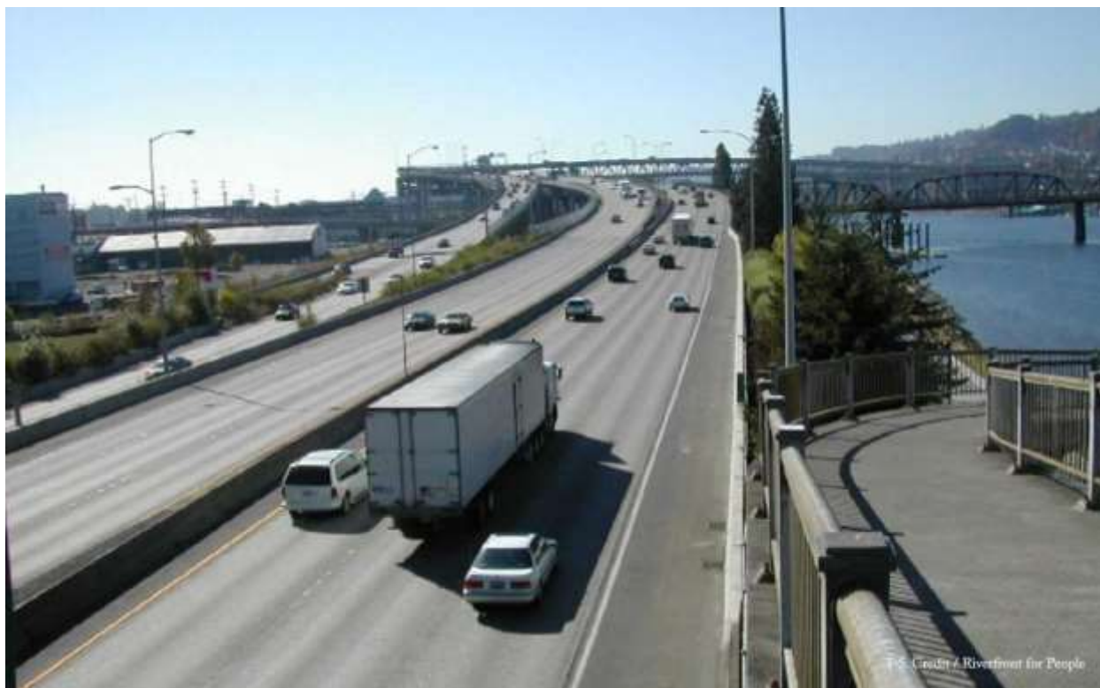
ภาพทางหลวงระหว่างรัฐ I-5 (Interstate 5) ในรัฐ Oregon

เหมือนเป็นการเหยียดหยันอดีต โดยการรื้อโครงสร้างทางหลวงระหว่างรัฐ (I-5) เชื่อมไปยังท่าเรือ ซึ่งครั้งหนึ่งทางหลวงระหว่างรัฐใหม่สายนี้ถูกสร้างขึ้นในปี 1966 เส้นทางนี้ถูกมองว่าเป็นการสร้างที่เกินความจำเป็น และถูกชาวเมืองรณรงค์ให้เกิดพื้นที่ริมน้ำสำหรับประชาชน (Riverfront for People) ได้รับการสนับสนุนและประสบความสำเร็จในการต่อสู้ ทำให้ทางหลวงระหว่างเมืองสายนี้ถูกรื้อออกไปและแทนที่ด้วยสวนสาธารณะริมน้ำ