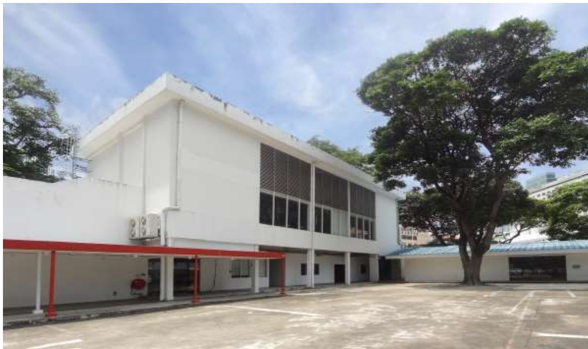
ปลูกสร้างของรัฐอย่าง 30 Maxwell Road สามารถเป็นบ้านใหม่สำหรับการใช้งานที่สร้างสรรค์