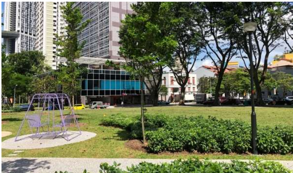
สวน Tras Link ที่เสร็จสมบูรณ์เมื่อไม่นานมานี้สามารถใช้เป็นพื้นที่ที่เหมาะสมสำหรับการเดินเล่นหรือปิกนิกตอนกลางวัน