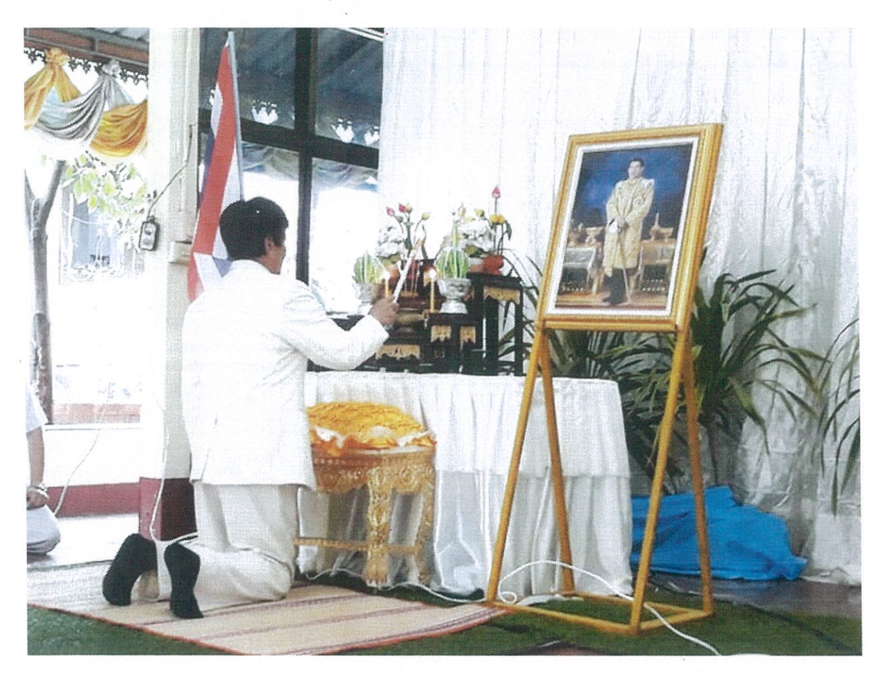
พิธีเปิดโครงการเสริมสร้างคุณธรรมและจริยธรรมของบุคลากร ประจำปังบประมาณ ๒๕๖๒ ในวันที่ ๑๖ กุมภาพันธ์ ๒๕๖๒ ณ วัดโพนวิมาน อำเภอเขาวง จังหวัดกาฬสินธุ์