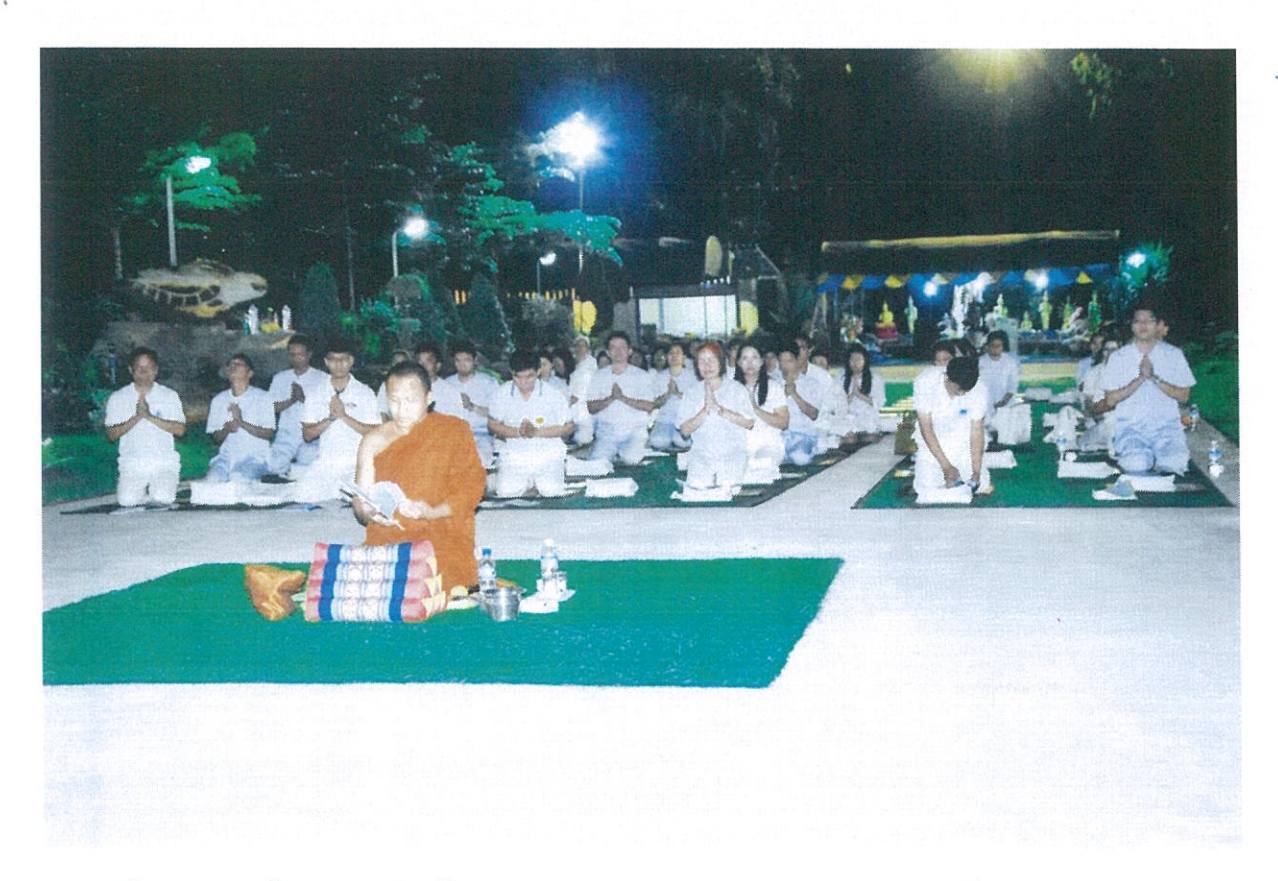
การฝึกอบรมตามโครงการเสริมสร้างคุณธรรมและจริยธรรมของบุคลากร ประจำปังบประมาณ ๒๕๖๒ ในระหว่างวันที่ ๑๖ - ๑๘ กุมภาพันธ์ ๒๕๖๒ ณ วัดโพนวิมาน อำเภอเขาวง จังหวัดกาฬสินธุ์